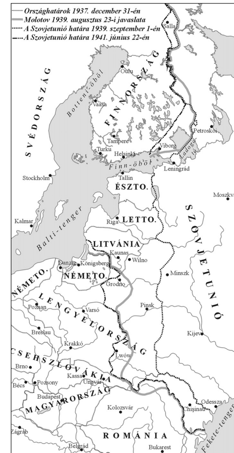
1. térkép. A Szovjetunió 1937. december 31-én, Molotov 1939. augusztus 23-i javaslata 17 , 1939. szeptember 1-i, 1941. június 22-i határai.

Sztálin minimális célja az 1941-es szovjet határok megőrzése ( 1. térkép ), a szomszéd kisállamok szovjetellenes összefogásának megakadályozása, valamint a kontinens politikai jövőjének befolyásolása erős, európai kommunista pártokon keresztül. A szovjet kormányfő eredetileg nem