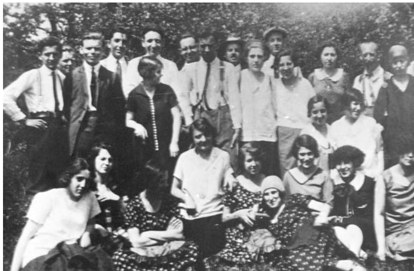
3. kép. MTE- és TTE-tagok az önerőből épített nagyszénási menedékház avatásán (1926)

maradását. Ez állna hát az identifikációs küzdelem mögött? Miért határolódik el mindettől élesen a vezetőség, miért küldenek pro vagy kontra állásfoglalásokat az egyes területi csoportok a vezetőségnek, s ezzel összefüggésben miért hangoztatják a kispestiek az osztály-, illetve proletár öntudat fontosságát? Mintha újfent egy paradoxonba botlanánk.