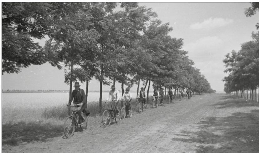
3. kép. Kerékpárosok az akácfasor alatt, Kunszentmiklós, 1949.

Ahogy Stephen Brain és Elena Kochetkova bemutatták, a Szovjetunióban folyó, valóban egyedi erdészeti politika távolról sem korlátozódott liszenkőista kísérletekre. 24 A társadalom- és humántudományi szakirodalomban Salvatore Engel-Di Mauro kutatásai tisztázták, hogy a Szovjetunióban a talajtant illetően különösen fontos eredmények születtek a második világháborút megelőző évtizedekben. Sőt, mivel a Szovjetunióban a kutatók és mérnökök komplex környezetgazdálkodási stratégiát fogalmaztak meg, az átalakítások egy része akár fenntarthatóbb is lehetett volna, mint a piacgazdaságokban született megoldások. 25