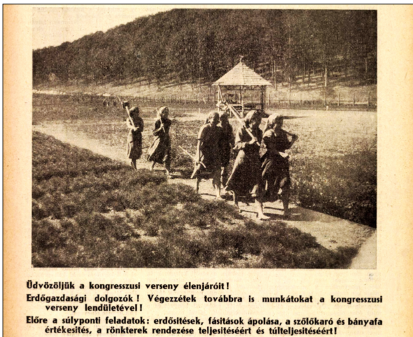
5. kép. Az erdőgazdaságok dolgozói a kongresszusi munkaversenyben. Az Erdőgazdaság 1954. május 25-i címlapja

volt a legkönnyebb összekapcsolni az új fásítási törekvésekkel. A faiskolai munkafolyamatot ugyanis 1950-ben nagyon részletesen szabályozták, és több tucat lépésből állt. Ez a lista ugyanabban az évben jelent meg, amikor bevezették a brigárendszer-t. 68 A fásítás a vetőmagok, különösen a fenyőfajták új körforgását is magával hozta. Az erdésznek kódneveket kellett használnia, például „Szombathely 2”, hogy jelezze, milyen fajtákat használ. 69