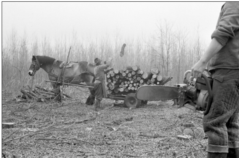
4. kép. Munkások rakodják az akácát, Csévharaszt 1972.

A Nagy Imre-kormány erdészeti tárgyú rendeletei összességében a normalitás iránti igényt fejezte ki, hogy a korábban az erdészeti igazgatás és a helyi lakosság kapcsolatát feszültté tevő és a faellátás szintjét rontó intézkedéseket kivezesse, s ezzel egy időben az anarchia irányába tartó diktatórikus mindennapokat igyekezett a kiszámítható és szakszerű irányba terelni az erdőgazdálkodásban is.